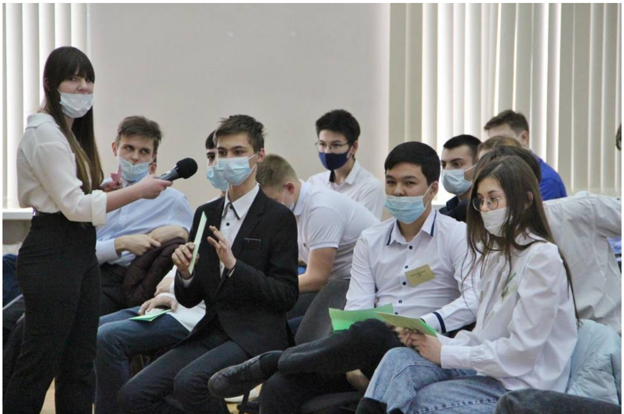
Викторина «Я – избиратель»