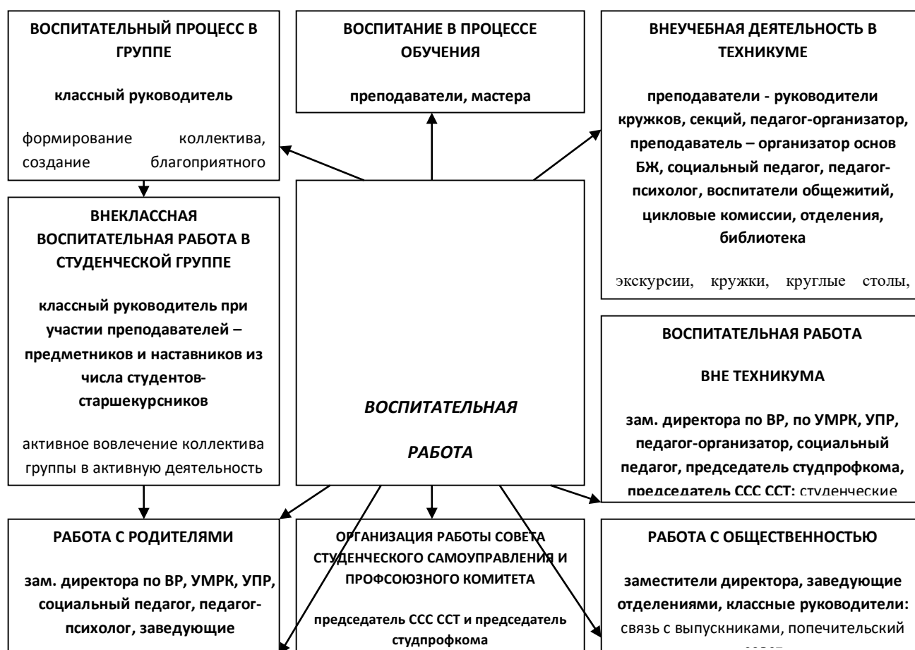
Рис. 1. Структура воспитательной работы в ГБПОУ «Ставропольский строительный техникум»

Формирование студенческого самоуправления является одним из методов подготовки будущих руководителей среднего звена предприятий и организаций. С целью формирования лидерских качеств студенческий актив за учебный год проходит несколько видов обучения.