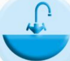
РАКОВИНЫ И СМЕСИТЕЛИ