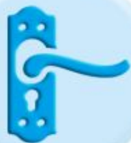
РУЧКИ ДВЕРЕЙ И ШКАФОВ

ТО, К ЧЕМУ МЫ ПРИКАСАЕМСЯ ЧАЩЕ ВСЕГО ДОЛЖНО БЫТЬ ЧИСТЫМ