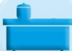
ПОВЕРХНОСТИ СТОЛЕШНИЦ, ПОЛОК