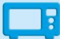
ПАНЕЛИ БЫТОВОЙ ТЕХНИКИ