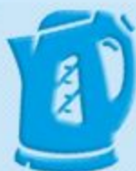
КНОПКИ БЫТОВЫХ ПРИБОРОВ